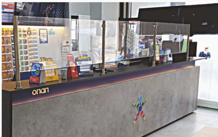
ΚΩΔ.252-22 Με κολωνάκια για τη reception