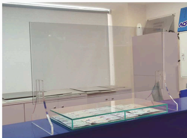
ΚΩΔ.253-22 Με διάφανη στήριξη - τρίγωνο

ΣΤΑΘΕΡΗ ΚΑΤΑΣΚΕΥΗ • ΥΛΙΚΑ Α΄ ΠΟΙΟΤΗΤΑΣ • ΕΥΚΟΛΗ ΤΟΠΟΘΕΤΗΣΗ